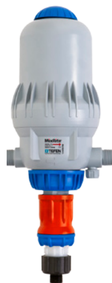
MixRite 2.5 0.8% (11 加仑/分)