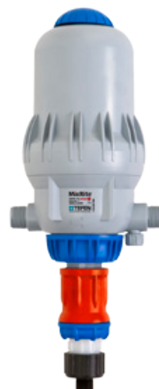
MixRite 2.5 0.8% (11 L/min)