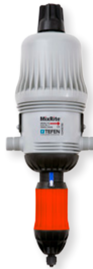
MixRite 3.5 PO