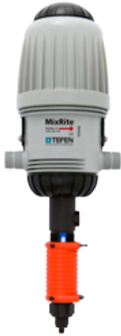
MixRite 2.5 PO