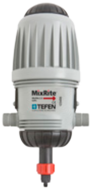
MixRite 2.5 0.8%