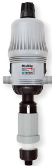
MixRite 3.5 1-10%